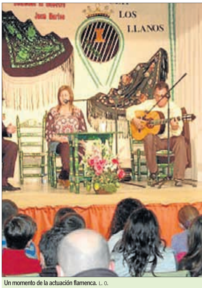
Un momento de la actuación flamenca.

La clausura de la XXXI edición de esta Semana de Cultura Andaluza se completó con la participación del Cuadro Flamenco de 'Solera', una actuación patrocinada por el Área de Cultura y Educación de la Diputación de Málaga. ■