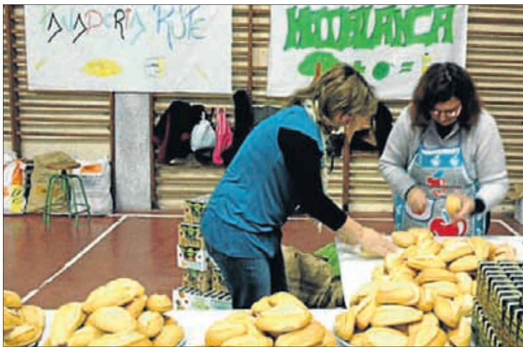
El desayuno andaluz que se preparó en el IES Martín de Aldehuela. L. O.

El viernes 19 se celebró en el IES Martín de Aldehuela el tradicional desayuno andaluz en el que no faltó el pan y el aceite. Una fiesta que no pudo haber salido adelante sin la colaboración de las empresas que regalaron al centro el aceite de oliva –Cooperativa San