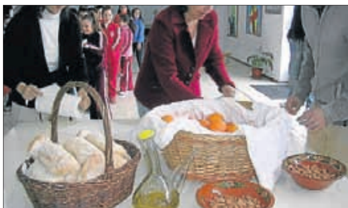
Los alumnos participan en charlas y talleres. A. G.

sumo de productos ecológicos, y trabajar con los centros educativos para educar a los más pequeños en el conocimiento de las bondades de estos productos.