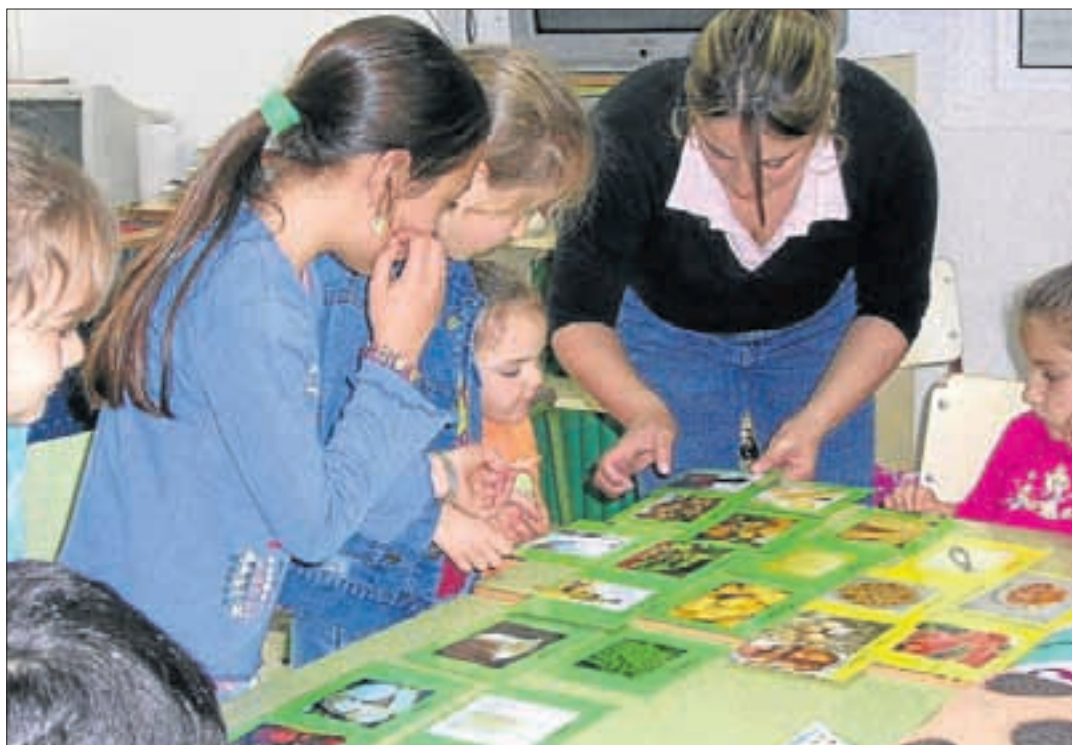
Una de las actividades en el colegio Félix Plaza de Alhaurín el Grande. A. G.

Con este nutritivo desayuno los escolares comenzaban la mañana para posteriormente recibir una charla informativa, mediante