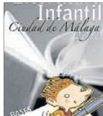
Cartel del certamen.

El Ayuntamiento de Málaga y Anaya convocan el I Premio de Literatura Infantil