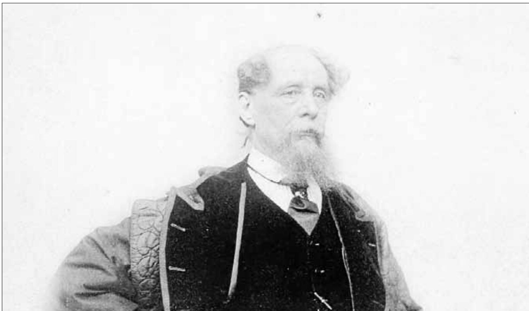
El escritor británico Charles Dickens (1812-1870).