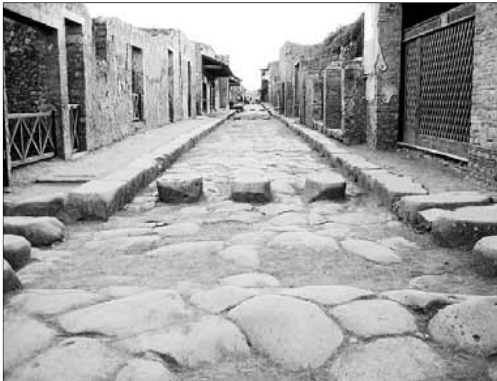
Vista de una de las principales calles pompeyanas.

La editorial Crítica acaba de publicar una acertada aproximación al mundo pompeyano gracias a la historiadora británica Mary Beard, a quien Crítica ya publicó el año pasado 'El triunfo romano'. La profesora Beard se propone desde el comienzo de la obra atraer la atención de lector y lo consigue con un estudio de Pompeya ameno y objetivo, capaz de desarmar con datos y razonamientos las numerosas creencias y leyendas que sobre esta ciudad han ido cayendo con la misma insistencia que la lluvia de cenizas volcánicas. Así, Pompeya no puede decirse que fuera una ciudad romana detenida en el tiempo. En el 62 d. C. se