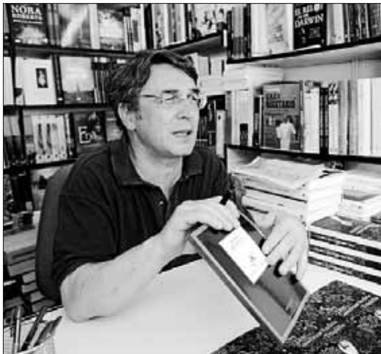
El escritor leonés Andrés Trapiello.

Su paraíso colombiano deviene en infierno social a la vuelta de ambos