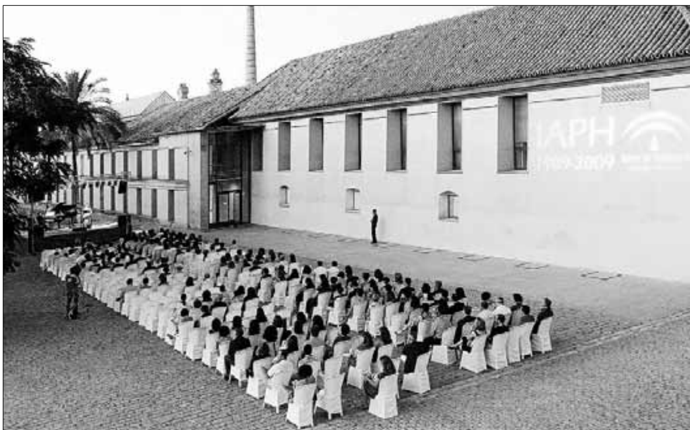
Un momento de la conmemoración de los veinte años de vida del Instituto Andaluz de Patrimonio Histórico.

Los trabajos sobre más de 10.000 piezas en el Centro de Intervención han incluido obras de extraordinaria significación social, como la Bandera de Andalucía, los bienes muebles del Palacio de San Telmo, la Iglesia del Salvador, el Giraldirillo –que le valió al IAPH el premio nacional de restauración–, Santa Isabel de Hungría curando a los tiñosos de Murillo, el Retablo mayor de la Capilla Real de Granada, la Puerta de Córdoba, el Tríptico de la Adoración de Baeza, Rueda elevadora de agua de las minas de Riotinto, el Hipnos de Almedinilla, el proyecto para la iglesia del