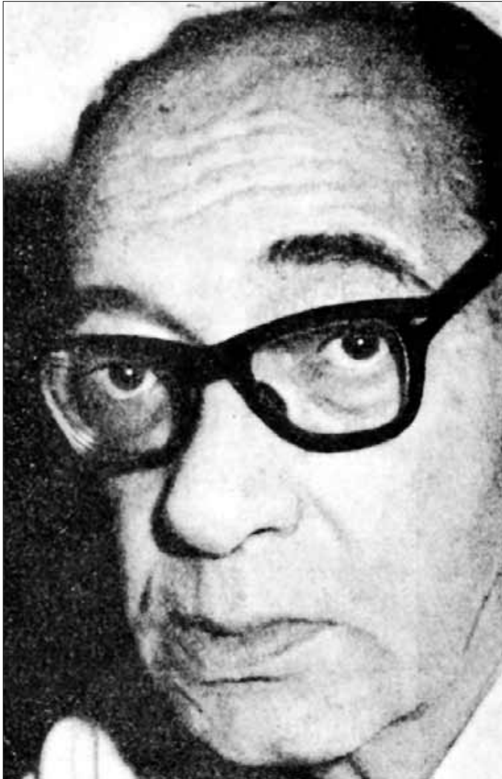
El escritor Juan Carlos Onetti, fallecido en Madrid en 1994. L. O.

El menoscabo que sufrieron las piezas breves del autor de 'El astillero' se debe interpretar con recelo. En ningún momento incluyó la marginación editorial ni estimuló a los gacetilleros, pero sí resulta un tanto incomprensible sin la concurrencia del contexto. Si algún crítico rioplatense saludó sus cuentos con exceso de tinta o de reserva la explicación probablemente se halle en el carácter único de su literatura. Onetti era un raro en la proyección latinoamericana del momento, empeñada en construir su propia identidad y alejada de propuestas menos coloristas y de trazos más difuminados como la del uruguayo. A pesar de su concomitancia espiritual con Cortázar o Rulfo, se trata de uno de los escritores con más