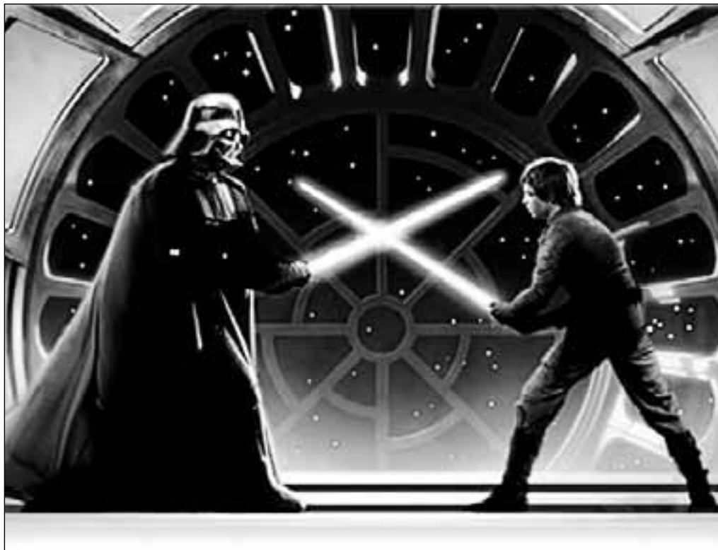
El autor del libro ve posible fabricar espadas láser en un futuro. L. O.

La primera habla de innovaciones que hoy no son posibles, pero sí